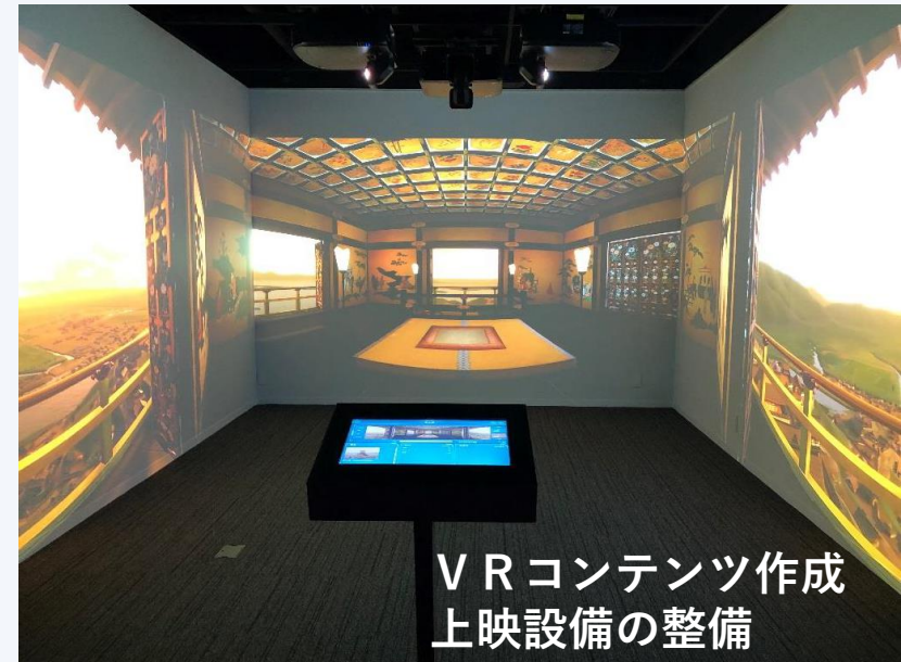
VRコンテンツ作成 上映設備の整備