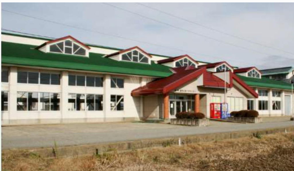
坂井屋内スポーツセンター（建物面積 1,768㎡） 坂井市坂井町上新庄 1 4 - 2 - 3