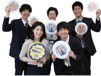
次世代のスポーツ推進事業チーム