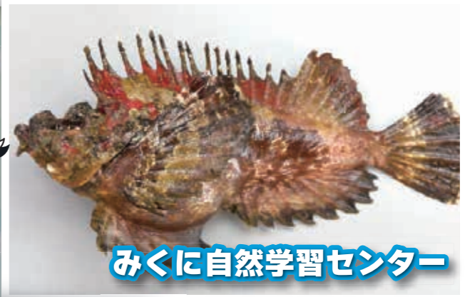
みくに自然学習センター

にんげんの皆様へたまには顔を見せてください。春の海も夏も海も珍しい生き物や沖縄のような水の景色が見られます。オニオコゼより