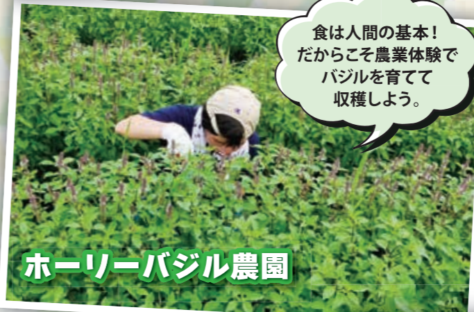
ホーリーバジル農園