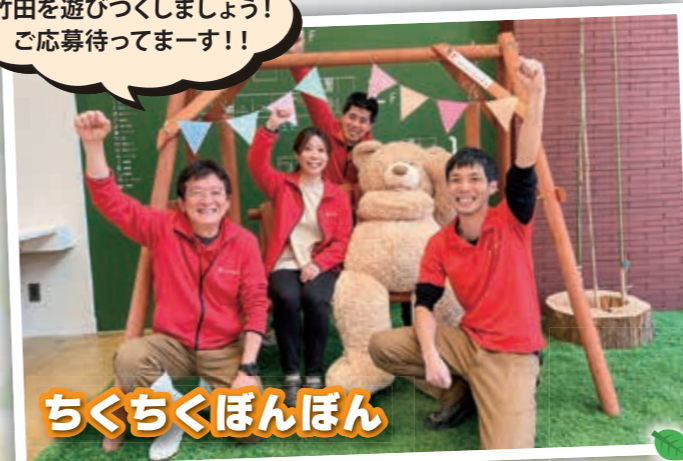
ちくちくぼんぼん

ちくちくぼんぼんの体験プログラムで竹田を遊びつくしましょう! ご応募お待ちしております!!