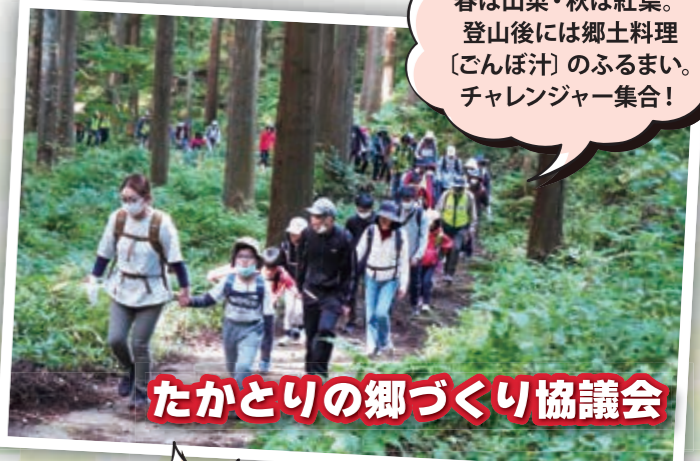
たかどりの郷づくり協議会

春は山菜・秋は紅葉。登山後には郷土料理 [ごんぼ汁] のふるまい。チャレンジャー集合!