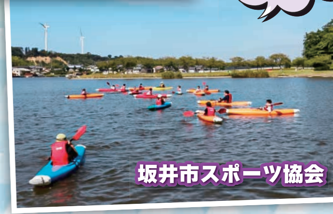
坂井市スポーツ協会