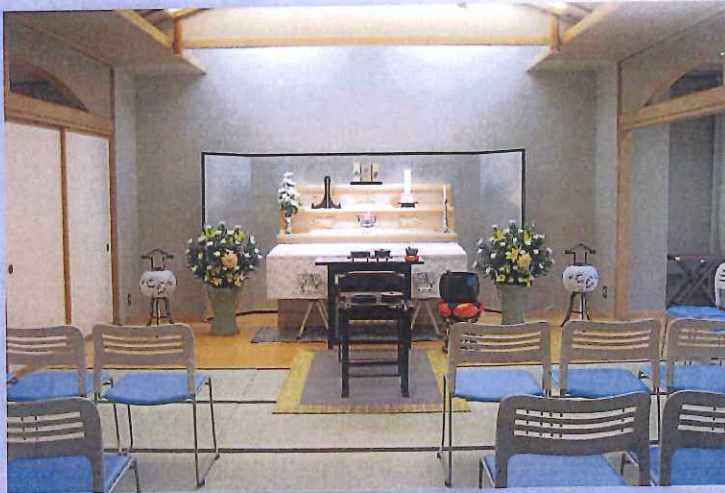
式壇使用料 2,100円(税込)…供花、供物等は含みません。