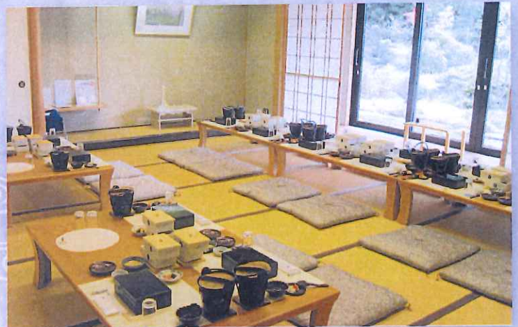
式場とは別に、利用料金は2時間で2,000円になります。