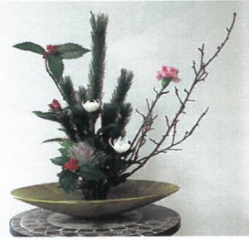
生け花 スイートピーの会

コミュニティセンター内のほっこりカフェでは、各種講座やつどいの家の皆さんからの季節を感じさせる作品が展示され、来館者の心を和ませほっと一息つける空間に一役買っています。