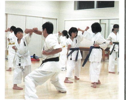
磯部地区空手同好会