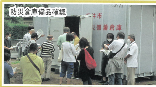
防災倉庫備品確認

その後、コミュニティセンターに移動し、地震発生時の避難の大まかな流れや一人一人が取り組む防災について説明を受けました。また実際に防災器具（簡易ベッド・簡易トイレ・簡易テント等）を組立その使用方法について学びました。