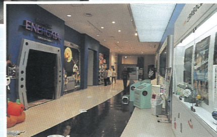
エルガイアおおい▶