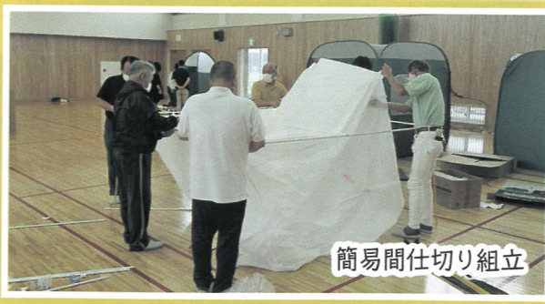
簡易間仕切り組立