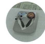
アロマワックスパーづくり挑戦