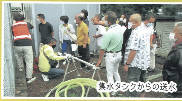
集水タンクからの送水