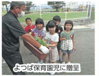
よつば保育園児に贈呈