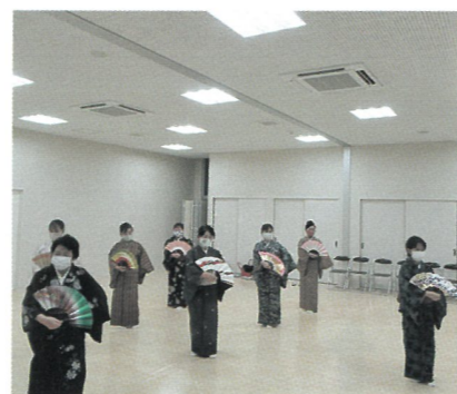
現代新舞踊 寿々波流 鳳扇会