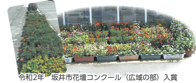
令和2年 坂井市花壇コンクール（広域の部）入賞