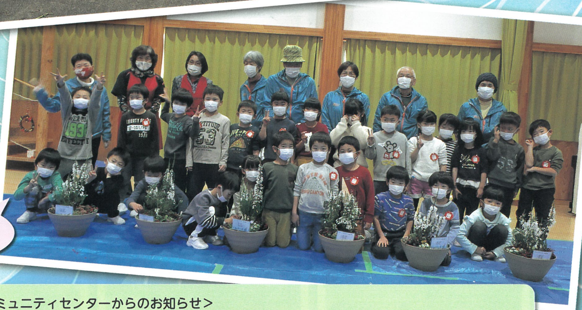
クリスマス寄せ植え体験 (よつば保育園)