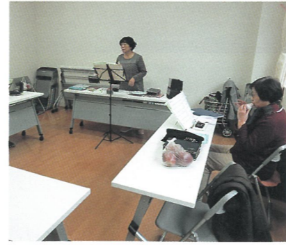
オカリナサークル磯部