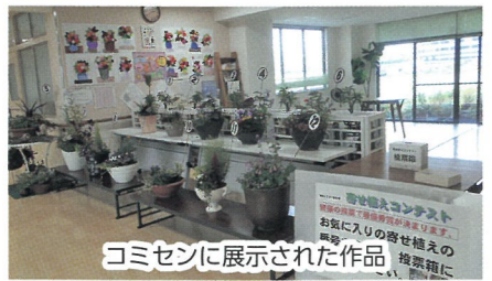
コミセンに展示された作品

「いそべ夏まつり」の中止のため、コミセンを会場に単独で実施しました。13の作品が展覧され、コミセン来館者の投票で最優秀賞、優秀賞を決定しました。