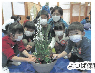
よつば保育園にて

年長組の園児がクリスマス会用の「大きな花鉢づくり（花の寄せ植え）」を行いました。