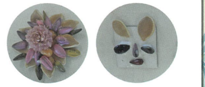
アートマグネットづくり挑戦