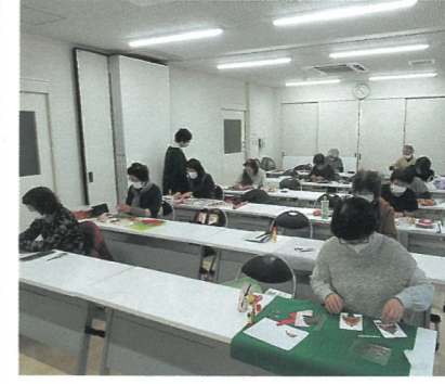
磯部絵手紙 こいこいの会