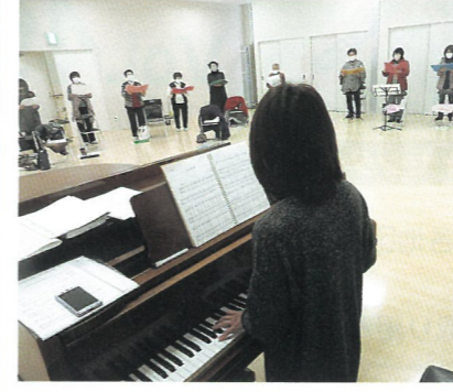
ヴォーチェ・ドルチェ・いそべ