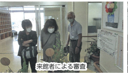
来館者による審査