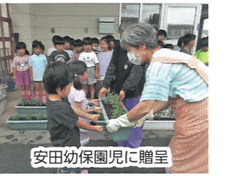
安田幼保園児に贈呈