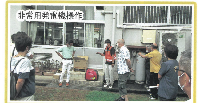
非常用発電機操作