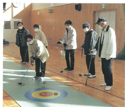
磯部高齢者健康教室 スティックリング