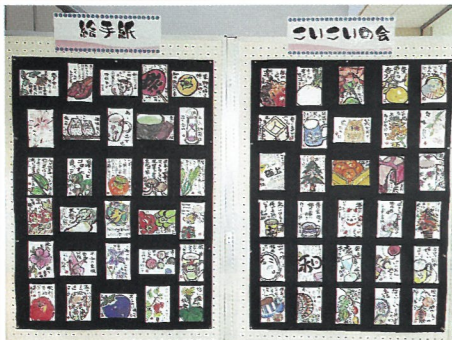
絵手紙 こいこいの会