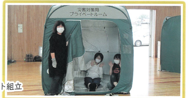
災害対策用 プライベートルーム