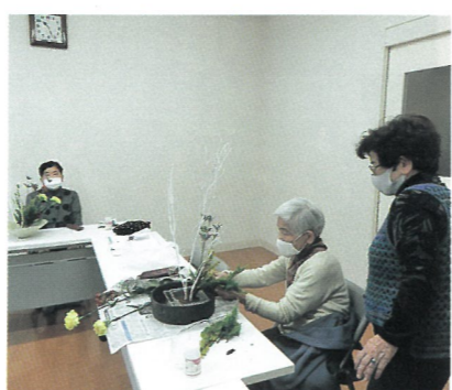
生花 スイートピーの会