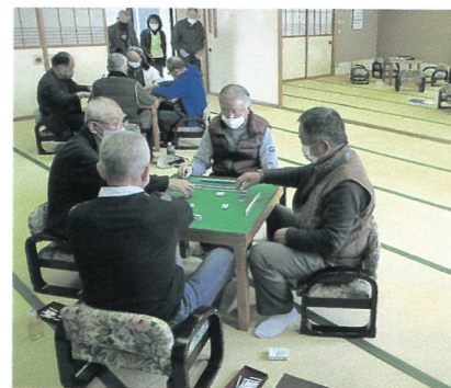
磯部健康麻雀倶楽部