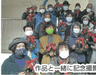
作品と一緒に記念撮影