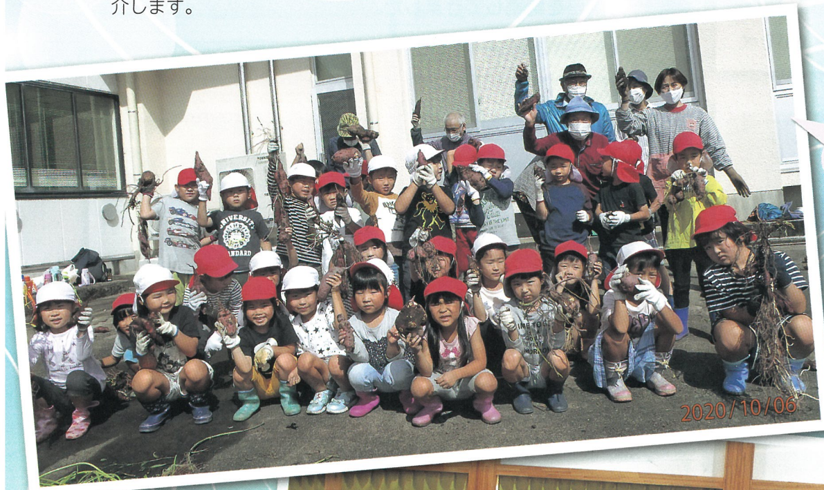
いもほり体験 (安田幼保園)

今回のわが故郷いそべでは、いろいろな制約を受けながらも各種団体が取り組んできた1年間の活動を紹介します。