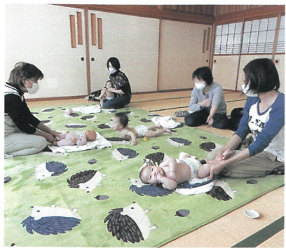
スマイルママ ベビーマッサージ