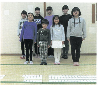
いそべかるた教室