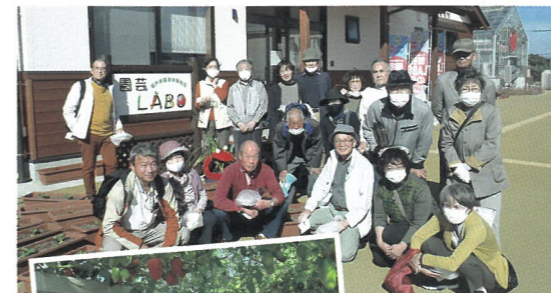
「園芸LABOの丘」を視察（美浜町）

本会では花の育成に限定せず、“花を活用した”研修や体験を開催しています。開催行事には会員だけでなく、地域で花に興味のある方達も参加しています。