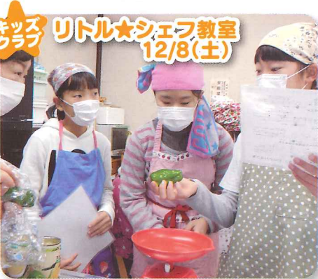
ミッヅ リトル★シェフ教室 12/8(土)