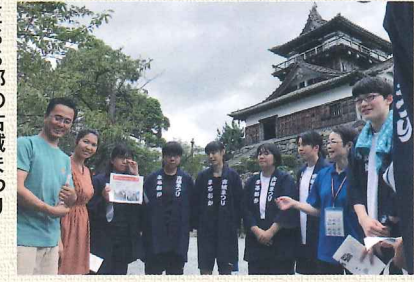
E.S.S部の古城まつり バイリンガルボランティア

美術イラスト部は商店街の店舗のシャッターにお静の絵を描いたプロジェクトを紹介しました。3ヶ月間、のべ16日間に行わたる地域活動に携わった苦労、そのやりがい、達成感を話してくれました。またE.S.S部は福井大学の留学生に英語でガイドしたり、外国人観光客に英語でガイドしたエピソードを紹介する中で、「苦しい点も多かったが丸岡城への愛がより強くなった。」と力を込めていました。英語が完璧でなくても伝えたいという意識からくるジェスチャーでなんとか通じることや、ガイドにおける臨機応変な対応も必要と感じたそうです。