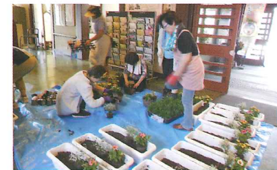
プランター植え替え作業 7月2日