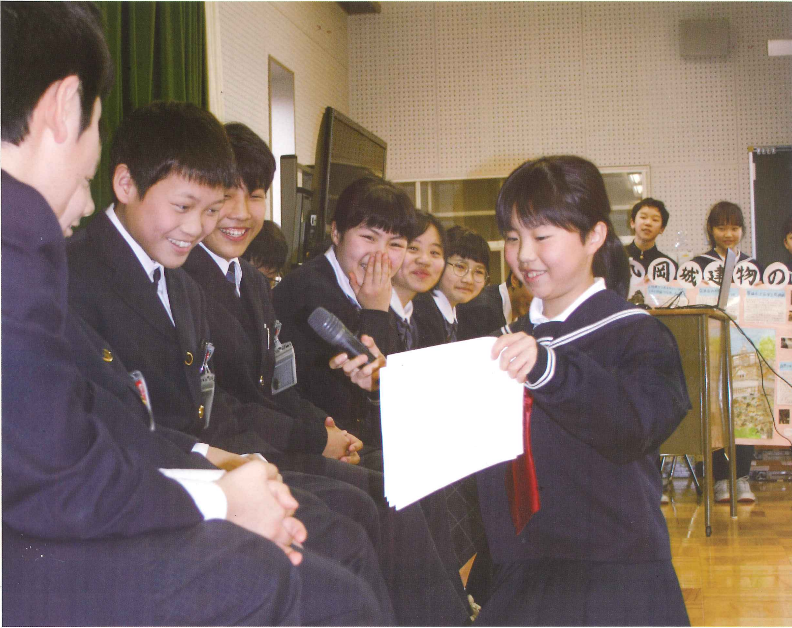
第3回 子ども歴史学習会 小・中・高「丸岡城サミット」風景 3月6日 平草小学校(P4・5記事)