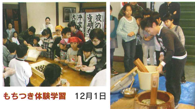
もちつき体験学習 12月1日