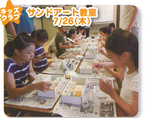
ミッヅ サンドアート教室 7/26(土)

編集後記 昭和から平成に変わった1989年1月7日。当時、小淵恵三官房長官の掲げた「平成」の書の写真は、今でもハッキリ、クッキリ目に焼きついていますし、ついでこの前の出来事だったようにも思います。今、元号がある国は、世界で唯一日本だけです。だから大事にしたいという思いがあります。 新しい元号となり「平成」が終わっても、城のまちまちづくり協議会設立当初の思いを大切に、老いも若きもともに力を尽くしていきたいですね。 (丸坊主あらため横分け)