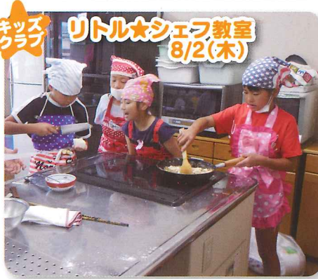
ミッヅ リトル★シェフ教室 8/2(土)