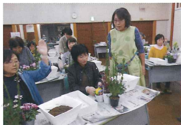
お花の寄せ植え講座 11月30日