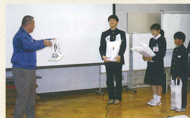
小中高生へ記念品贈呈

全ての発表の後は小中高生が丸岡城の好きなところや、これから国宝化にむけてすべきことなどを議論し、結びに丸岡高生が後輩たちに「これで終わりではなく、県外の友達に誇れるようさらに盛り上げよう。」と呼び掛けていました。