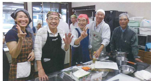
男の料理教室(寺子屋部会) 9月29日 「上手いかわなくても、悪戦苦闘しても、自分で作った料理は絶対に美味しい!」という信念のもと、料理に挑戦しています。豚の梅風味煮・ほうれん草の白和え・越のルビーのさっぱりスープ・ずんだ白玉を作りました。