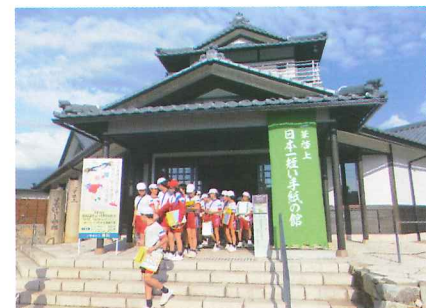
子ども歴史学習会 10月25日 平草小学校児童5年生を対象に一筆啓上 日本一短い手紙の館・丸岡歴史民俗資料館を見学しました。歴史を学び、郷土に誇りをもってもらうきっかけづくりになりました。

平草小学校児童が丸岡城天守の拭き掃除を行いました。天守への誇りと愛着心を胸に、床や柱などを隅々まで磨き上げました。一般社団法人「丸岡城天守を国宝にする市民の会」の呼びかけで毎年行う協力事業です。この日は5年生69名が市民の会のメンバー10名と作業しました。児童は1階から3階の床を雑巾がけ。柱や窓際も丁寧に拭き上げました。拭き残しがないか目を配り、一時間の作業で汗ばむ児童もいました。