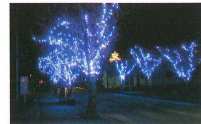
2018イルミネーション