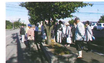
夏花植え替え作業 6月17日