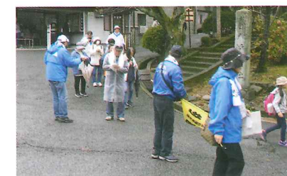
クリーンアップウォークラリー 10月28日