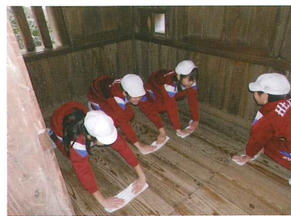
丸岡お天守びかびか運動 12月20日

平草小学校児童が丸岡城天守の拭き掃除を行いました。天守への誇りと愛着心を胸に、床や柱などを隅々まで磨き上げました。一般社団法人「丸岡城天守を国宝にする市民の会」の呼びかけで毎年行う協力事業です。この日は5年生69名が市民の会のメンバー10名と作業しました。児童は1階から3階の床を雑巾がけ。柱や窓際も丁寧に拭き上げました。拭き残しがないか目を配り、一時間の作業で汗ばむ児童もいました。