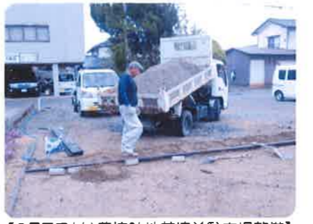
【6月7日（水）農協跡地花壇前駐車場整備】