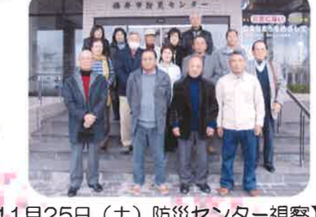
【11月25日（土）防災センター視察】