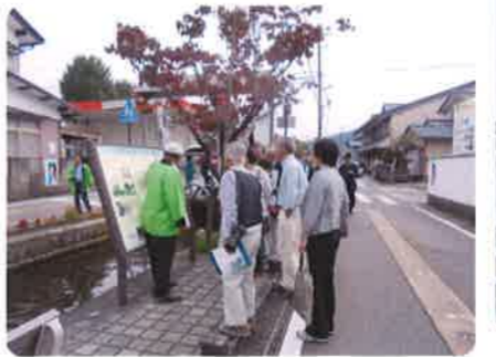
【10月11日（水）東郷地区と九頭竜川流域防災センター視察】