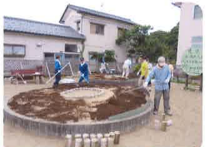
【7月9日（日）農協跡地花壇花植え】