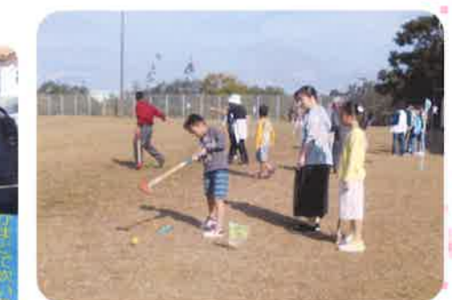
【10月7日（日）グラウンドゴルフ大会】