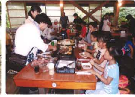
【8月7日（月）ぶどう狩り体験とバーベキュー】