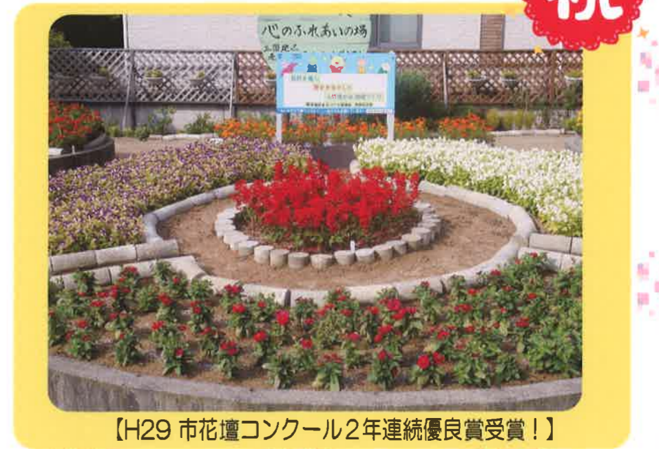
【H29 市花壇コンクール2年連続優良賞受賞！】