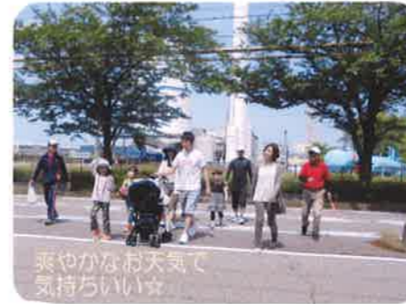
【5月14日（日）健康ウォーキング】