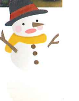
モグモグパクパク