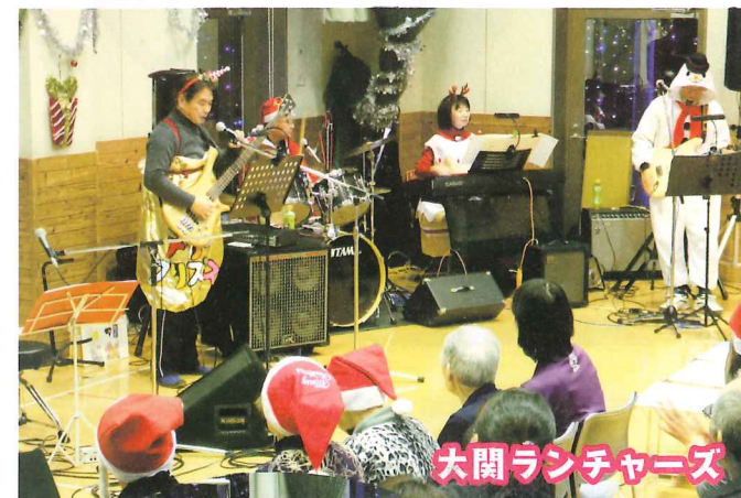
大関ランチャーズ

令和元年12月22日(日)大関コミュニティセンターでクリスマスチャリティーコンサートを開催。