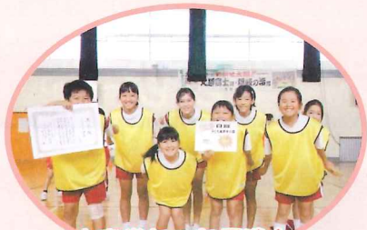
★高学年の部優勝★ CCチキン