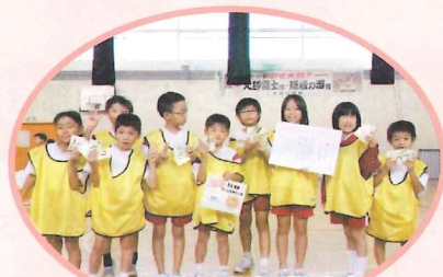
★低学年の部優勝★ 大関ちびっこファイターズ