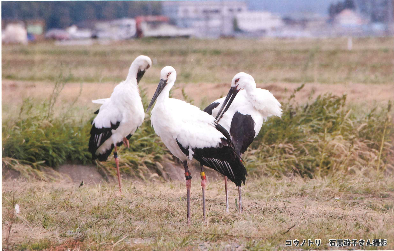
ヨウノトリ