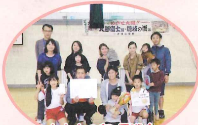
★大人の部優勝★ 上蔵