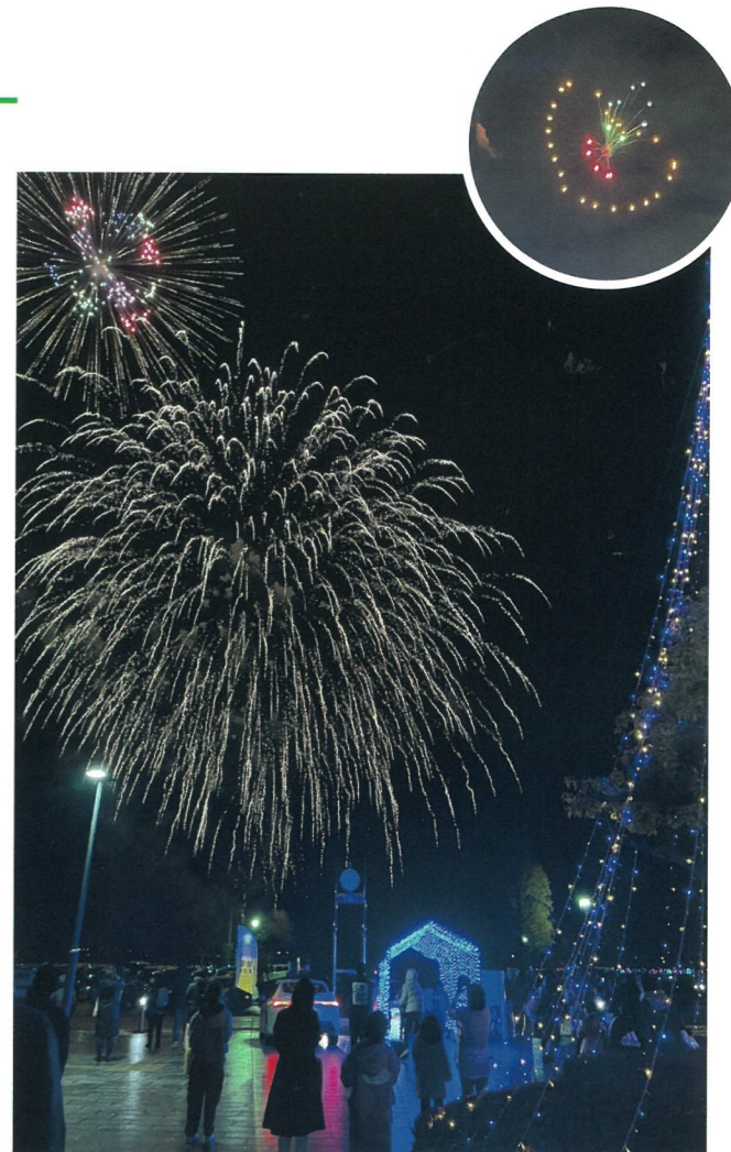
▲地域を照らす光のコラボを見上げる来場者たち。花火になった郷ちゃんを見た人はいいことあるかも~♪(写真右上)