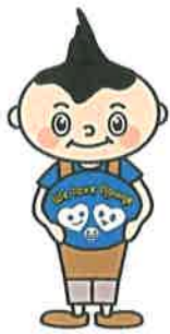
オリジナル キャラクター 「さとちゃん」