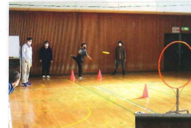
↑ディスクゴルフ体験会