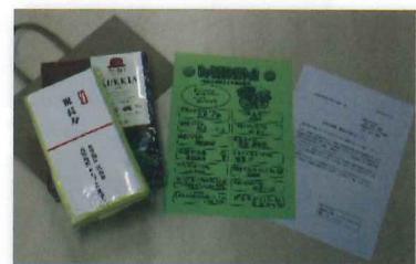
↑お年寄りへの記念品とメッセージ