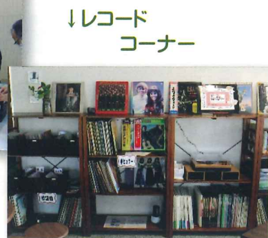
↓レコードコーナー

地域みんながふれあう活動に取り組んでいます。昨年度は、カフェコーナーに皆様から寄付していただいたレコードを設置し、3月に開催したコミセンのサークル発表会に合わせレコード鑑賞会を実施して楽しんでいただきました。