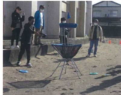
▲ディスクがなかなか思うところに飛ばず苦戦することも。