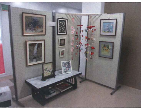
▲押し花やちぎり絵、つるしびなど色とりどりの美しい作品のそろう踏み。