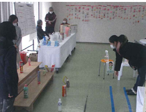
▲「輪投げで商品GET！」商品までの距離が意外に遠い・・・。