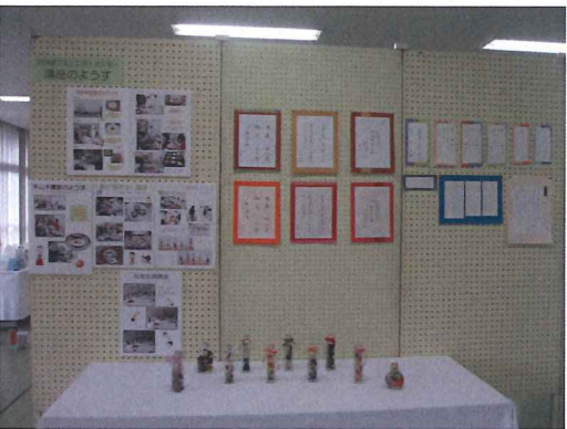
▲自主講座「ボールペン・筆ペン講座」講座制の作品。字の美しさにうっとりです。