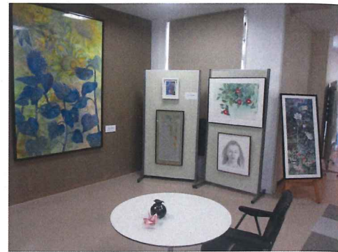
▲色鮮やかな水彩画に目を奪われます。