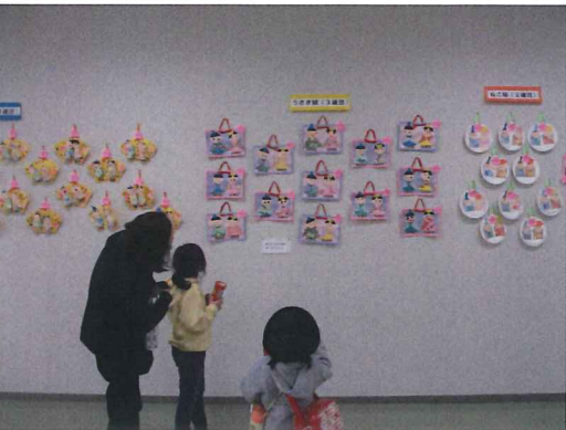
▲米納津保育所園児の皆さんによる、可愛いひな祭りの作品。見ているだけでほっこり。