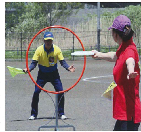
アキュラシー (的入れ)