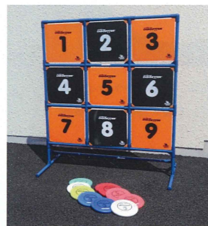
ゲッターナイン (的あて)

※駐車場は臨海体育館、米納津区民館駐車場をご利用ください。(台数に限りがございます)