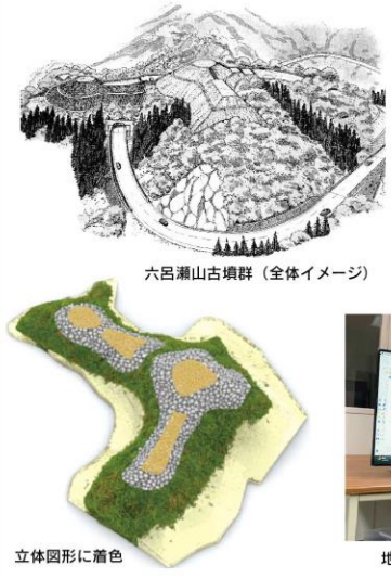
六呂瀬山古墳群 (全体イメージ)