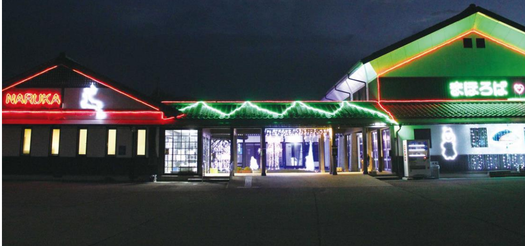
イルミネーション 11月8日から年末まで鳴鹿地区を明るく照らしました。