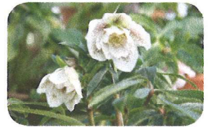
(クリスマスローズ)

春江東部地区まちづくり協議会広報担当(春江東コミセン内) URL http://haruetobu-machikyou.com/ 坂井市春江町中筋28-1-1 (TEL & FAX 51-0187) e-mail haruhigashi-cc@city.fukui-sakai.lg.jp