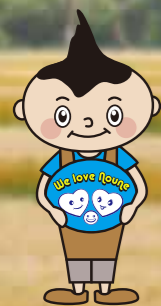
オリジナルキャラクター「さとちゃん」

長畝地区区長会、のうねの郷づくり推進協議会および、各種団体、並びに地区民のみなさま、日頃はのうねの郷づくり協議会に深いご理解とご協力を賜りありがとうございます。