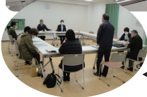
▲ 総会後の部会開催