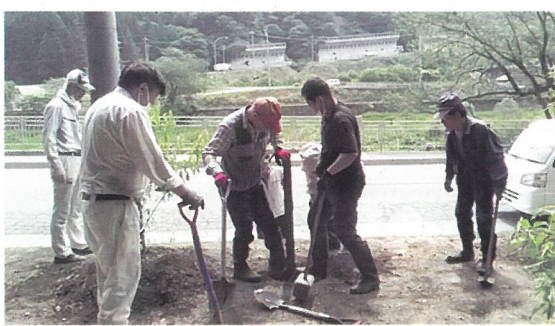
ボランティアによる森づくり活動（大野市）