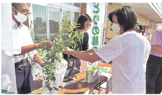
緑化苗木の配布（鯖江市）