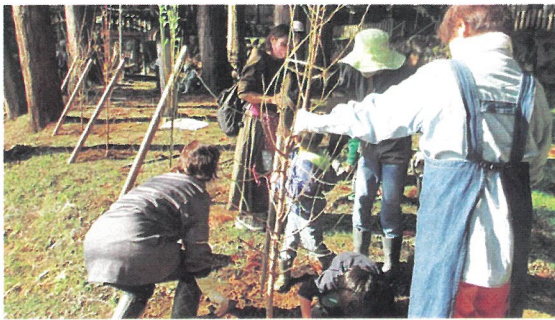
地域での植樹活動（越前市）