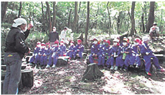
子どもたちの森林学習（若狭町）