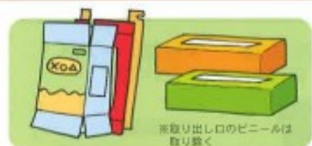
ティッシュやお菓子などの空き箱

「雑がみ」とは、新聞、雑誌、ダンボール、紙バック以外のリサイクルできる紙のことです。