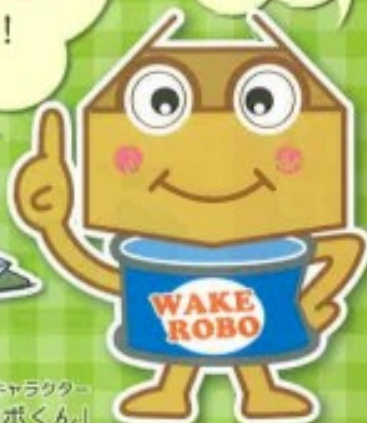
坂井市ごみ減量キャラクター 「ワケロボくん」