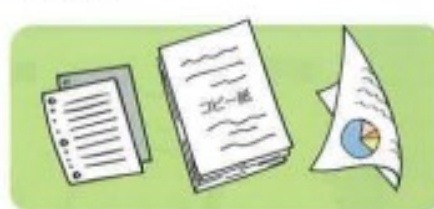
メモ用紙、コピー用紙、プリント