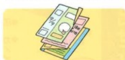
パンフレット など