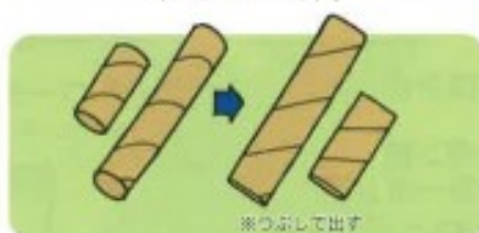
トイレトペーパーの芯