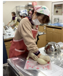
アンコール企画 『ハードパン』