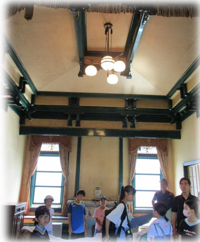
写生会☆島崎家を描く