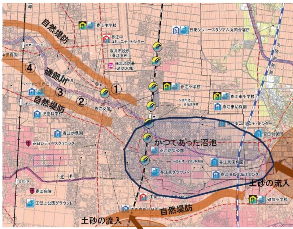
前回の訂正図・磯部川周辺の遺跡

前回、磯部川の自然堤防を中心に人が住み始めたことを説明しました。ここでお詫びですが、前回のコラムの編集時に説明図のレイアウトが崩れ、そのまま印刷してしまいました。下に訂正図を載せますので参照してください。