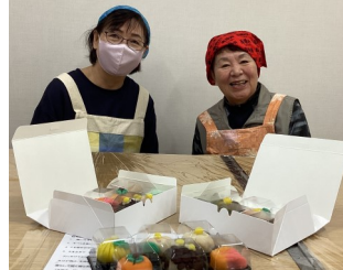
『四季の彩り季節の練り切り』