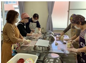
『手ごねで作るハードパン』