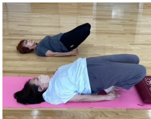
『体の歪みを整える体操』