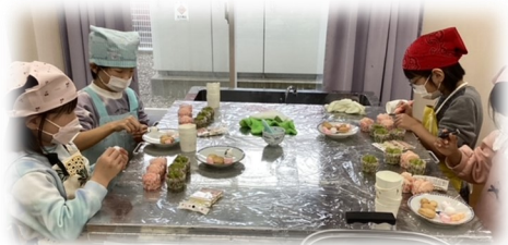
おひなさまの蒸しパン作り