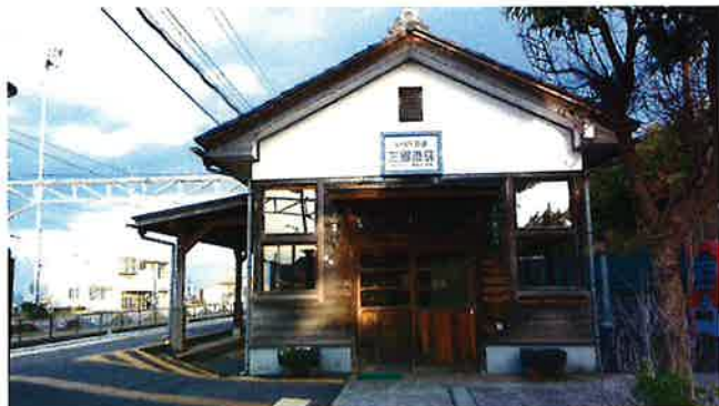
「えちぜん三国みなとえき」