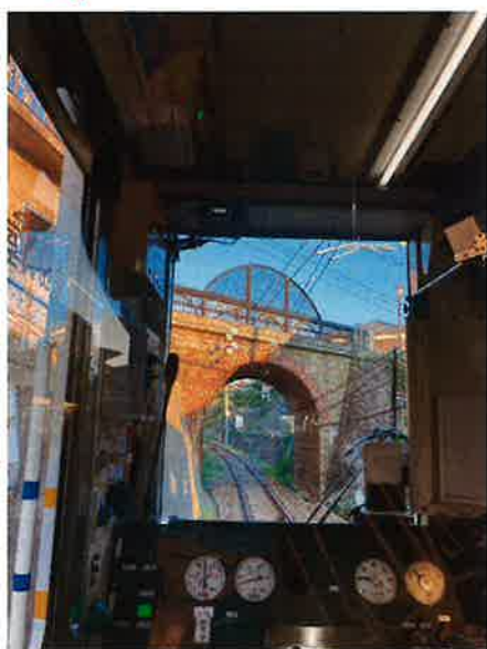
「えち鉄の中からの眼鏡橋」