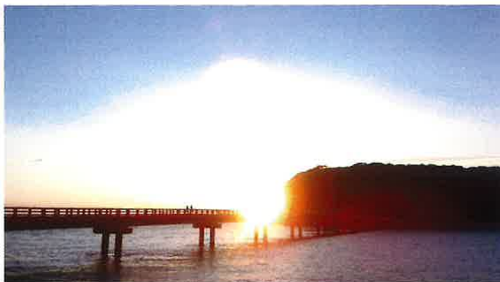
「おしまばしのきれいな夕日とやま」