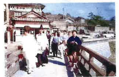
(※カラー写真に加工後)