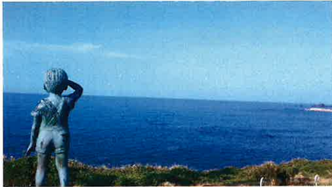
「雄きれいな空と海」