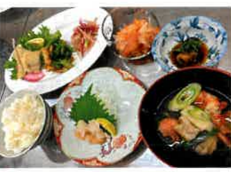
メニュー ミズウオのすまし汁、ミズウオの唐揚げ、バイ貝の刺身、バイ貝のバター炒め

て敬遠されがちなミズウオです。そのミズウオの皮をきれいにむき、米粉をまぶし唐揚げにするメニュー。講師のさばき方に11人の参加者は「こんなに簡単にできるの。唐揚げはふわふわの食感と淡泊な美味しさに舌鼓をうっていました。知らないふるさとと味。次の食材も楽しみます。