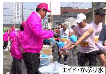
エイド・かぶり水