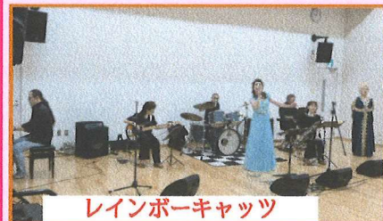
レインボーキャッツ

さわやか唱謡会さんのさわやかな歌声に心が和まされ、レインボーキャッツさんの迫力ある歌声や懐かしいメロディーに魅了されました。