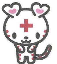
日本赤十字社公式キャラクター