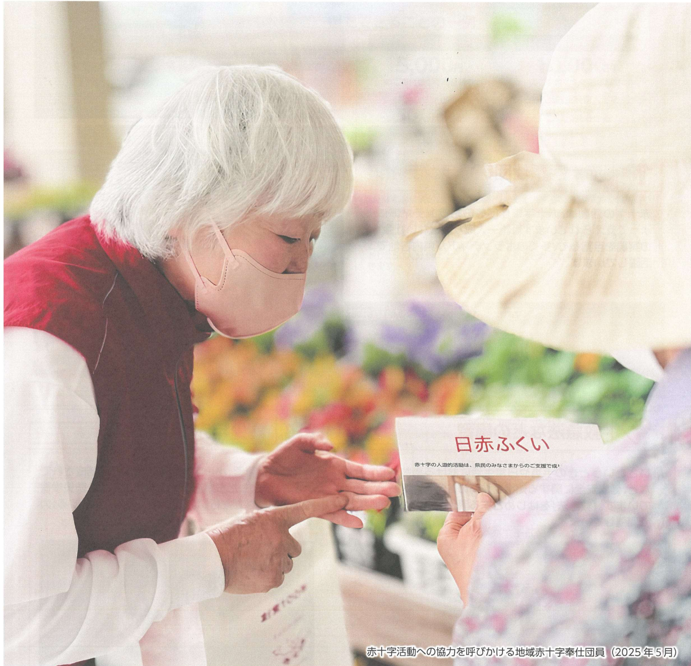
赤十字活動への協力を呼びかける地域赤十字奉仕団員（2025年5月）