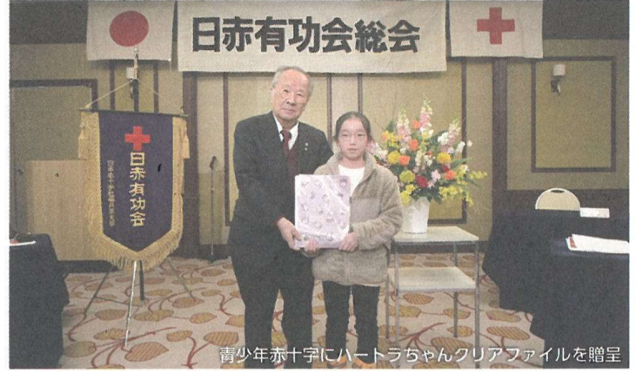
青少年赤十字にハートちゃんクリアファイルを贈呈

福井県日赤有功会は、赤十字活動に賛同した有功章受章者で組織されている支援団体です。継続的な寄付などにより赤十字を支えています。