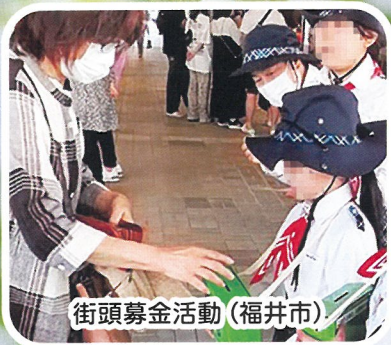
街頭募金活動（福井市）