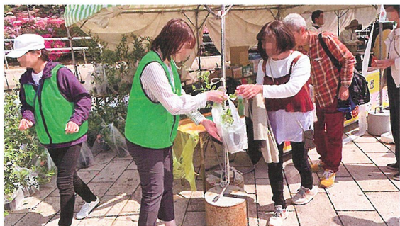
緑化苗木の配布活動 (鯖江市)