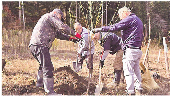
地域での緑化活動 (大野市)