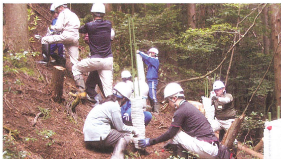
子ども達の森林学習活動 (小浜市)