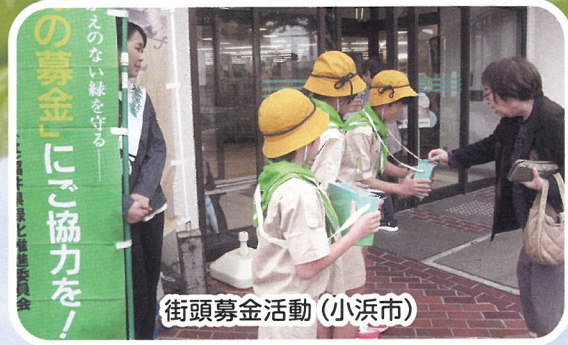
街頭募金活動（小浜市）