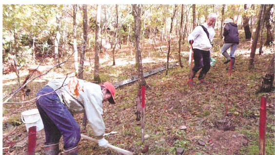
ボランティアによる森づくり活動 (永平寺町)