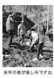
来年の春が楽しみですね

3月20日(金・祝)今年で3回目のドコモ北陸さんが、子ども森運営委員会と竹田の里づくり協議会の協力でしだれ桜の苗木を植樹しました。(千古の家の奥山に10本) そして、曾谷区周辺に千古の家が、しだれ桜を50本植えられる竹田地区内のしだれ桜は、766本になりました。