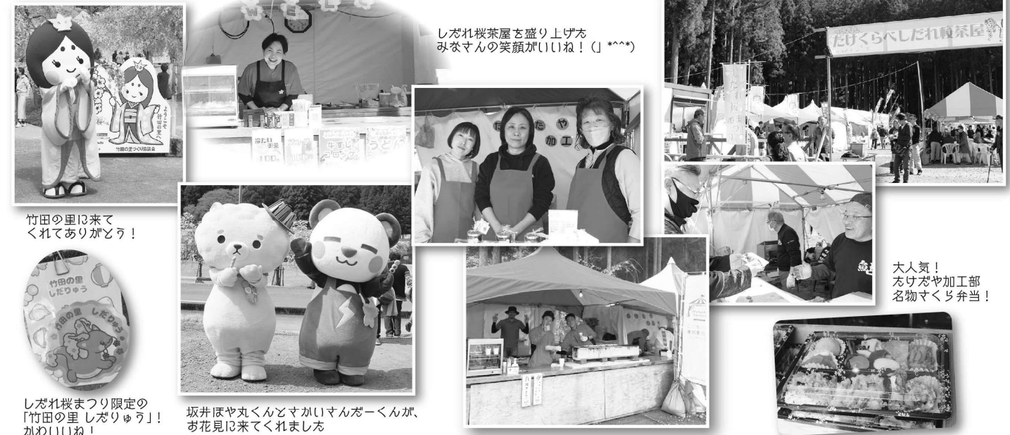
竹田の里に来てくれてありがとう！