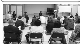
～基本目標～ 住みたくなる里 いきいき竹田を創ろう

「お知らせ」 「涼み処さかい」 暑い時は、坂井市クワリーグシエルトー施設をご利用ください。 ちくちくぼんぼん 竹田コミュニケーションセンター コミセンが子どもの居場所づくりに取り組む一年が経ち、ただいまが長敷小学校からスクールバスで帰ると元気にコミセンに帰ってくるようになりました。少ない人数ですが、いつも元気に挨拶をしてくれて、こちら元気のパワーをもらいます。(〇香)