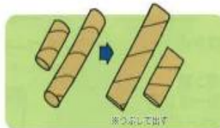
トイレットペーパーの芯