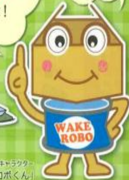
坂井市ごみ減量キャラクター 「ワケロボくん」