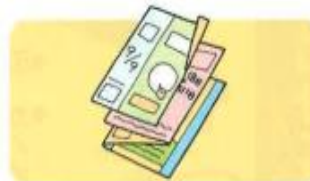
チラシ、パンフレット など