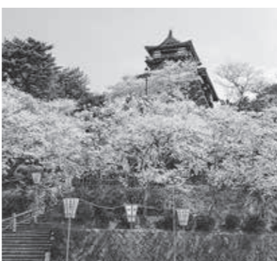
▲日本さくら名所100選に選ばれた丸岡城

A 写真でたどる「見せる改修」の写真展コーナーの設置など、首里城での取り組みも参考にしながら公開方法について検討したい。