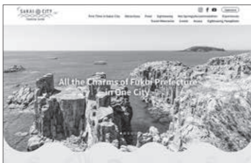
▲令和6年4月にリニューアルした公式観光サイト「さかい旅ナビ」

A 福井県広域ウエルネス推進協議会の取り組みに協力しながら、観光庁の「特別な体験の提供等によるインバウンド消費の拡大・質向上推進事業」の推進も行っていく。