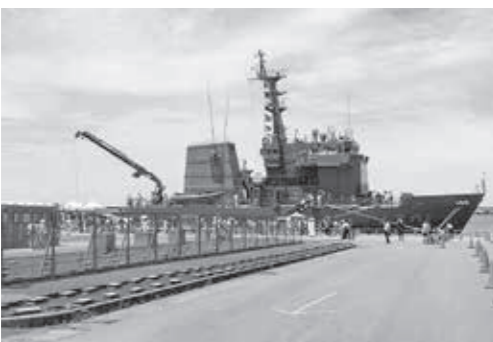
▲海上自衛隊の一般公開。多用途支援艦「ひうち」と大勢の見物者(7月7日福井港)

Q 本市が、法的研究はしていない。通知は、技術的助言で従わなくてもよいはず。 A 国の考え方が明確化したので、市として、提供に応じた。