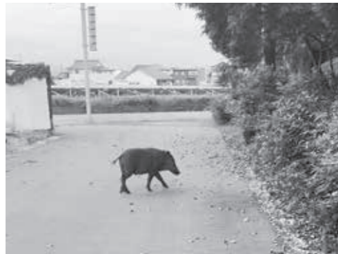
▲住宅地にも出没するイノシシの様子(三国町新保地保)

また、豚コレラの終息により、丸岡地区ではイノシシが増加しているが、捕獲隊などによる徹底した捕獲の管理により、成果が