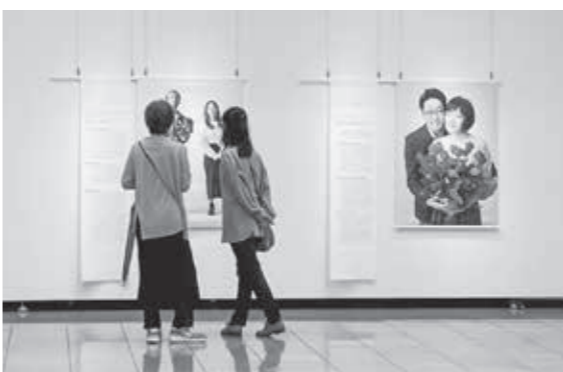
▲ふたりの未来をイメージしてみる写真展（ハートピア春江）

A 女性の婚活イベント参加者が少ないことが課題である。伴走型の相談員、メンターの養成に取り組み、不安を抱える市民に寄り添う予定である。