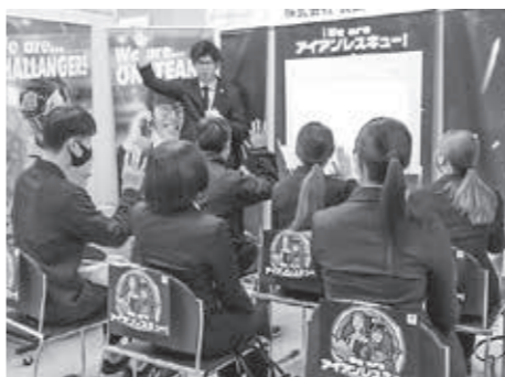
▲坂井市合同就職説明会で、地元企業に質問する学生たち(令和6年3月13日)

令和6年度、ウエルビーイングを総合戦略の視点とした、後期基本計画の策定に着手している。