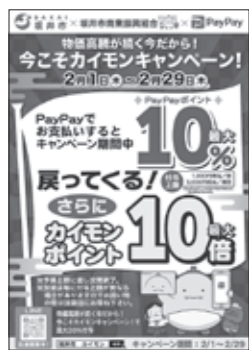
▲令和6年2月に実施したカイモンキャンペーンのチラシ

これまで、コロナ禍や物価高といった社会情勢があり、国のコロナ交付金を活用し実施してきた。市単独予算では、財政負担も大きく、国や県の経済対策を見極めながら、効果的な支援策を検討する。