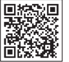
▲議会ホームページ (政務活動費について)