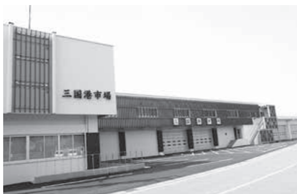
▲能登半島地震により雨漏りが発生した三国港市場

A 林道のパトロールとあわせグレーチング同士をつなぎ合わせるなど、盗難にあわないような対策を検討していく。