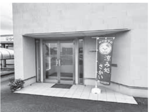
▲クーリングシェルター「涼み処さかい」を示すのぼり

Q クーリングシェルターの設置状況は。 A また、民間施設の応募状況、および市内全域を網羅しているか。