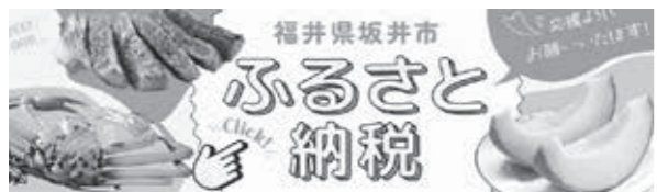
▲ 寄附市民参画事業のバナー広告

A 寄附市民参画事業での施策で、3年間1,000万円ずつと考えているので、令和6年度、令和7年度と続けていく予定である。