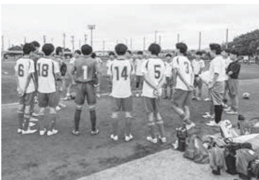
▲本格的に動き出した部活動の地域移行

Q 文化部の地域移行に関しては。運動部の移行状況を参考にし、令和7年度末をめどに地域移行を進めていきたい。