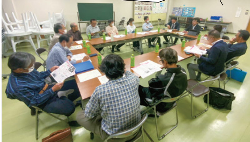
▲ 浜四郷コミュニティセンターの様子

○日時:5月29日(水)19時～ 会場:浜四郷・江留上・坂井木部 各コミュニティセンター