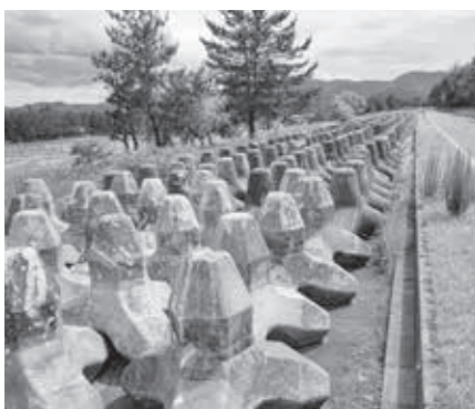
▲国道305号線沿いのテトラポット

Q 20年ぶりに新紙幣が発行されるが、相談や支援の取り組みは。新紙幣に係る支援の要望などは現在受けていない。