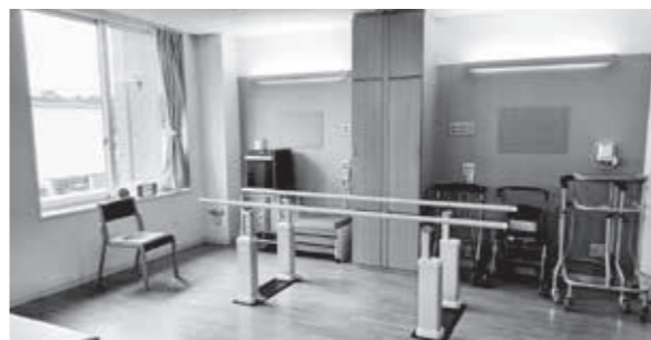
▲三国病院の新設リハビリテーション室

A 令和6年度の4月から病棟8床を、リハビリの機能訓練室に変更した。また、訪問リハビリをできるだけ早い時期から実施していきたい。