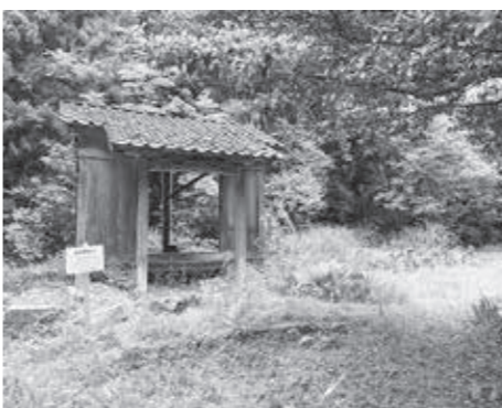
▲草が生い茂る旧白山神社跡（丸岡町豊原地係）

A 本市が作成した再生古地図や、DMOさかい観光局が作成した丸岡城下町マップを活用した丸岡城周辺の周遊だけでなく、豊原も含め、市内観光スポット情報を掲載したパンフレットなどでPRを図り、誘導できるように取り組みたい。