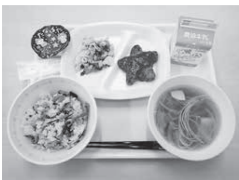
▲七夕給食（三国学校給食センター）

Q 今の決め方では、価格が急騰した場合、給食食材費の変更に難しく、食材費が不足することが予測されるが、その点をどのように対応していくのか。