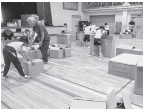
▲高椋小学校の防災合宿の様子

A 救急指定病院への管路や浄水場など主要水道施設・避難所周辺の管路などを中心に、順次、計画的に事業を進めていく。