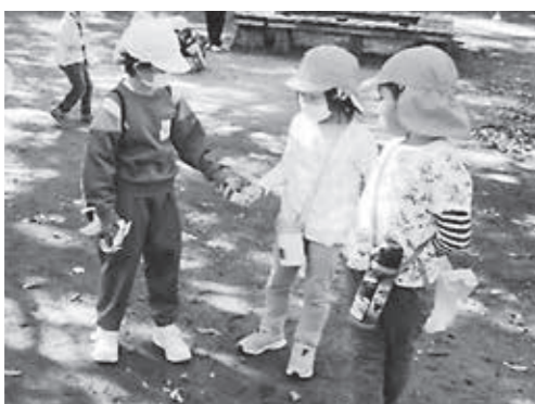
▲小学生と未就学児の触れ合い

A 授業教材として新聞を活用した学習に積極的に取り組んでおり、探究的な学習を進める上で、課題