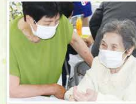
時間を忘れて はずむ会話、笑い！！