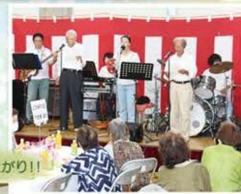
コンサートは大盛り上がり！！