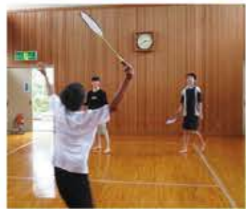
鳴鹿第2コミセン バドミントン