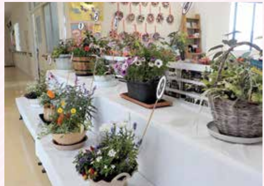
コンテスト応募作品 どの作品も個性的で彩り豊かに植え込みが されています