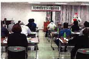
浜四郷地区 まちづくり協議会

4/18 「体協浜四郷支部」、 4/25 「浜四郷地区まちづくり協議会」の総会が開かれました。 令和5年度の事業・収支決算報告ならびに令和6年度の事業計画 案・収支予算案などが審議され、いずれも承認されました。 明るく住みよい豊かなまちづくりのため、皆様のご協力、 ご参加をよろしくお願いいたします。