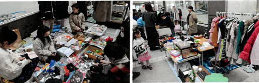
おもちゃ、おしゃれ着「何でもあるよ」。笑顔で接客