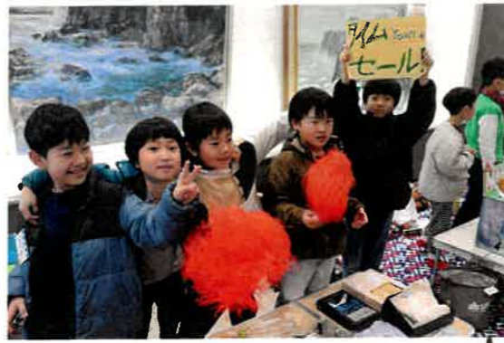
子どもフリーマーケット ワタシのお店 大繁盛

小学生のフリーマーケット8店がすらりと並びました。手作り品、おもちゃ、古着などがところ狭しと置かれ、開店と同時に品さだめする人がたくさん詰めかけました。