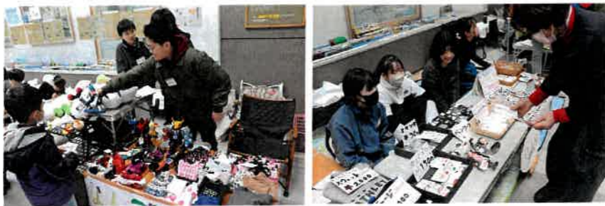
世界にひとつ、手作りのお宝。「いらっしゃいませ」の声響く