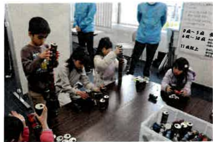
輪投げに鉄砲、缶積み、お菓子すくい。歓声響く