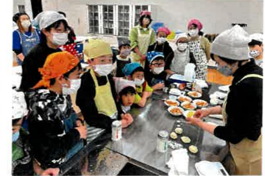
親子で手づくりパンに挑戦