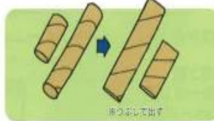
トイレトペーパーの芯