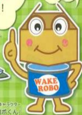
坂井市ごみ減量キャラクター 「ワケロボくん」