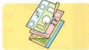
チラシ、パンフレット など