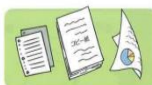
メモ用紙、コピー用紙、プリント