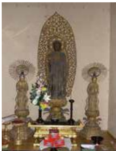
阿弥陀三尊来迎仏(称念寺)