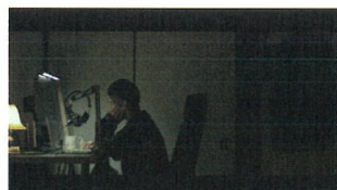
<My Dear Ghost House>2023

1994年三国町生まれ。映像作家。現在フランスを拠点に活動。2022年「泡沫少女」国際映画祭にて20個の賞を受賞。2023年つくろい監修×西端監督「神楽、舞う瞬間」最優秀音楽賞を受賞。表現の幅を広げるべく、フランスへ短期移住中。