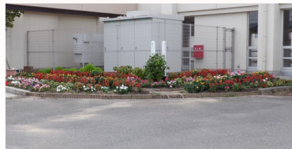
コミュニティセンター(まち協)