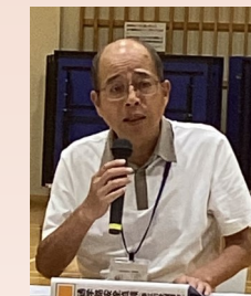
春西見守りネットワーク 西木会長