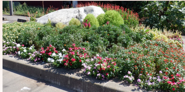
中庄区さわやかクラブ