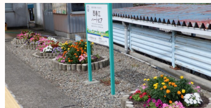
西春江ハートピア駅(まち協)