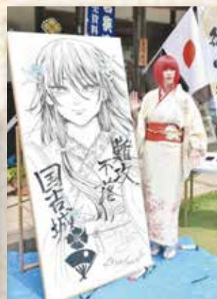
#福姫プロジェクト