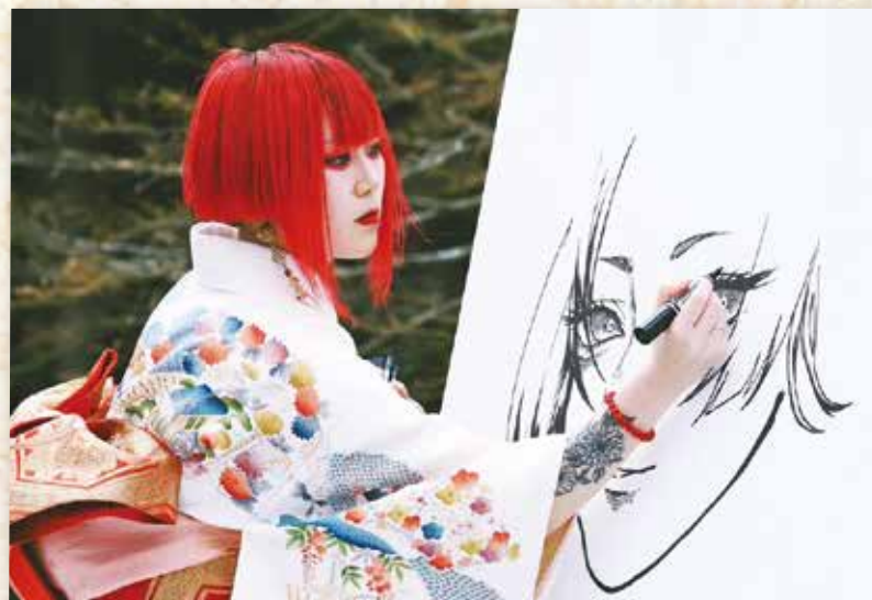
外部協力：合同会社進化ランド アバター事業