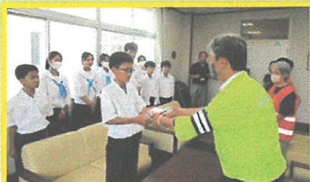
中学生に自転車反射材贈呈