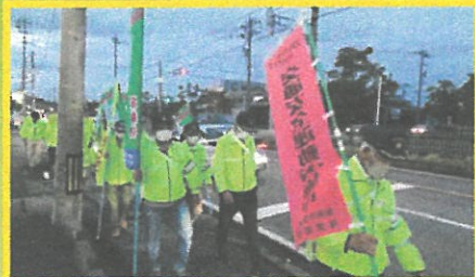
反射材着用パレード