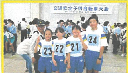
交通安全子供自転車大会に雄島小4名が参加