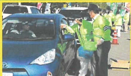
交通事故なし(梨)の配布