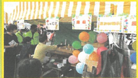
イーザ創業祭に参加(交通安全グッズ釣り、射的など)