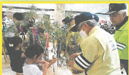
交通安全七夕の実施 米納津保育所園児の参加