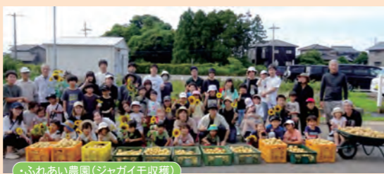
・ふれあい農園(ジャガイモ収穫)