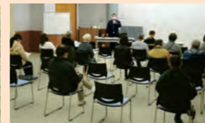
・生活福祉講座(特殊詐欺防止)