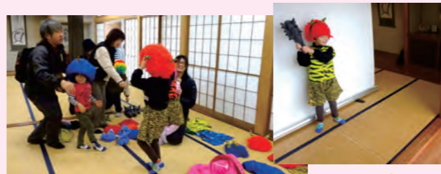
思い思いのコスチュームで変身した子鬼をパチリ、思い出の缶バッジに