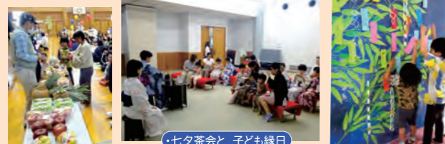
・七夕茶会と子ども縁日