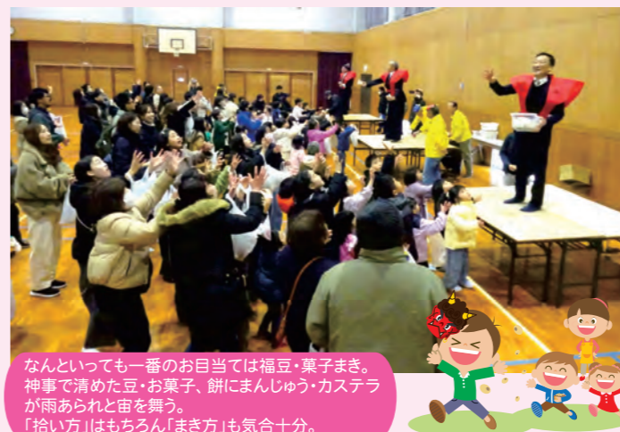
なんといっても一番のお目当ては福豆・菓子まき。神事で清めた豆・お菓子、餅にまんじゅう・カステラが雨あられと宙を舞う。「拾い方」はもちろん「まき方」も気合十分。

年々来場者が増え会場は約150人の親子で大賑わいとなりました。かわいらしい赤鬼・青鬼・カラフル鬼に目を細める保護者、みんなで協働の恵方巻、親子で興奮の福豆菓子拾い、今年もたくさんの笑顔と歓声による邪気払いで無病息災、開運が訪れることでしょう。