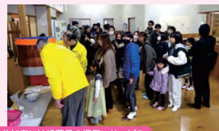
参加者には綿菓子の振舞いサービス