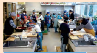
・支援共催(敬老会、放課後子ども教室)