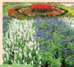
・おもてなし花壇、花いっぱい