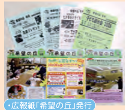
・広報紙「希望の丘」発行