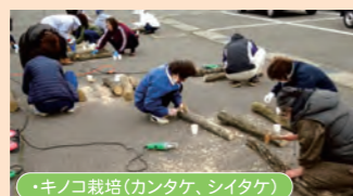
・キノコ栽培(カンタケ、シタケ)