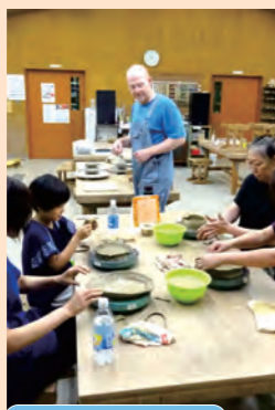
・ものづくり(ガラス・陶芸)