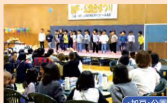
・加戸・公園台まつり