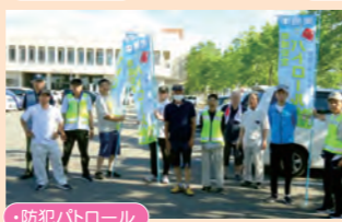
・防犯パトロール