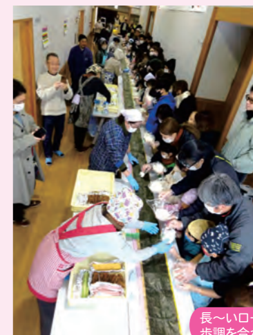
長〜いロール状の海苔に酢飯・具材のをせ歩調を合わせジャンボな恵方巻を作りあげる