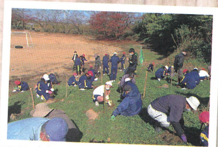
小学校での緑化活動 (あわら市)