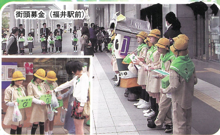
街頭募金 (福井駅前)