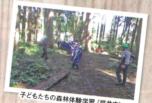
子どもたちの森林体験学習 (福井市)