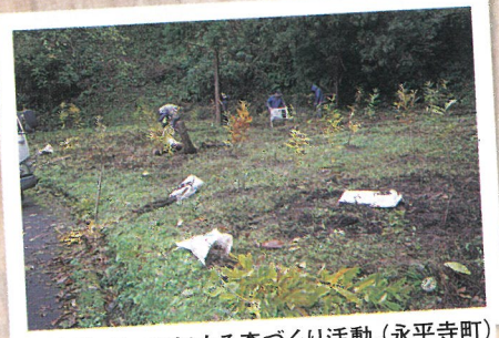
ボランティアによる森づくり活動 (永平寺町)