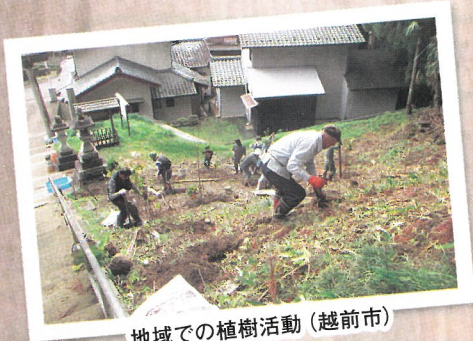
地域での植樹活動 (越前市)