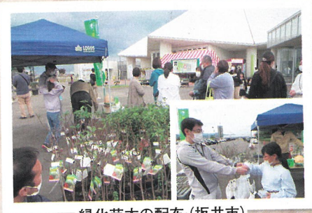
緑化苗木の配布 (坂井市)