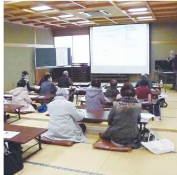
開催:のうねの郷第二コミュニティセンター

野菜作りの年間計画や土づくり・肥料等についての基礎を学び、春野菜や夏野菜の植え付け準備のポイントを教わりました。受講生のみさんは先生の丁寧でわかりやすい説明を熱心に聞き、時々メモを取るなど野菜作りに意欲満々でした。