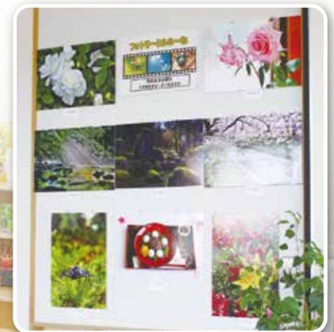
▲フォトサークルの〜ね写真展示

コミセン使用後の仲間とおしゃべりや雑誌鑑賞など、ご自由にご利用ください。オンデマンドタクシーの待ち合わせや散歩中の休憩にもどうぞ。