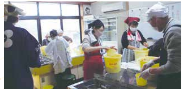
開催:のうねの郷第二コミュニティセンター

体に良い発酵食品の味噌が材料を混ぜるだけでおいしくできる！とあって、毎年参加される方いるほど大人気の講座です。塩麴や八丁味噌の話聞きながら、40分程の作業時間で完成。味噌に仕上がる11月上旬までの置き場所や重石など、味噌の管理についても詳しく教えていただきました。