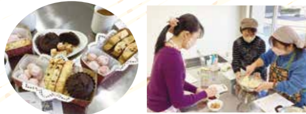
開催:のうねの郷コミュニティセンター