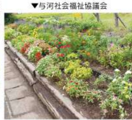
▼与河社会福祉協議会