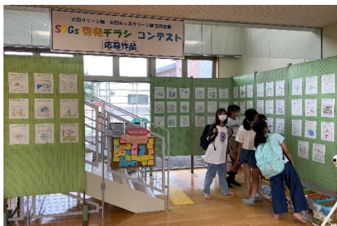
▲大関コミセン内展示の様子