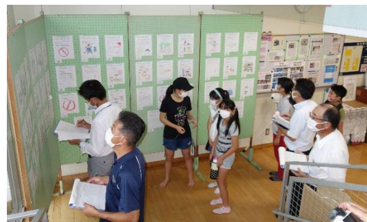
▲SDGsチラシ審査会の様子