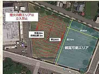
※危険を伴う演舞ですので、上図の観覧可能エリアにて見学してください

「初めて手筒を放揚するときにはもの凄く緊張していて、火が熱くても緊張で何も分からないうちに終わってしまっていますが、4、5年するとだいたい慣れてきます。(中略)ベテランになってくると火が熱くても我慢できるようになり、鉄粉が刺し手に落ち、「シカシカ」と落ちる火の粉に、何ともいえない気分になります。