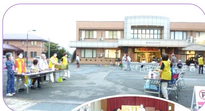
『郷の夕べ』 実行委員で 準備の様子

9月は、26日から「駅舎で展示」10月は、16日に「鉄道フェア」・30日に「レコードを聴く会」と続きます。皆様のお越しをお待ちしています。