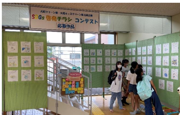
▶作品展示の様子1階ロビー

大関コミュニティセンターでは、大関小学校、坂井中学校の96名の児童生徒が応募してくれたSDGs啓発チラシコンテストの作品を展示しています。どれもこれも大関地区をきれいな町にしようという子どもたちの思いが詰まった素晴らしい作品ばかりですのでぜひ見に来てください。