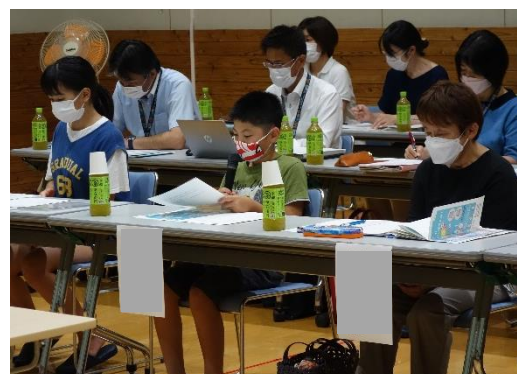
▶大人の中で堂々と発表する大関小学校児童交流ホール

先日行われたさかい未来創造座談会で、大関キッズクリーン隊として環境問題に取り組む大関小学校5年生の児童たちは、ゴミ探検など自分の体験を通して感じたことや自分たちの目指す未来像を坂井市長へ向け堂々と語りました。一緒に参加した大人たちも児童たちの姿に大関の明るい未来を見ることができました。