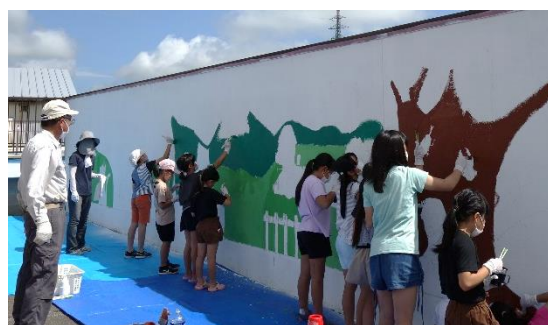
▶笑い声を響かせながら楽しく色を塗る小中学生