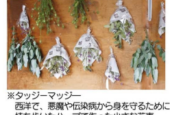
※タッジーマッジー 西洋で、悪臭や伝染病から身を守るために持ち出しハーブで作った小さな花束

上茶屋」で販売されているとのこと。また最近では、畑で作っているハーブを使って、タッジーマッジーを作ったり、ラベンダードライフラワーを使い茎にテープを巻いていく。ラベンダーバンドルズ、という匂い袋のようなものも作っておられるそう。お伺いしたその日もちょうどラベンダーのドライフラワーバンドルズをつくっておられ、夏らしい色合いとラベンダーの香りから清涼感をいただきました。