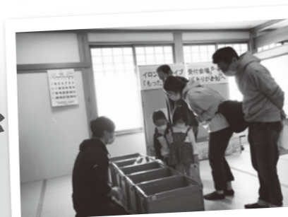
～「もったいない」から「ありがとう」へ～ イロンドライブ