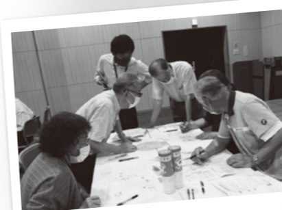
見守りマップづくり支援