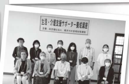
生活・介護支援サポーター養成講座