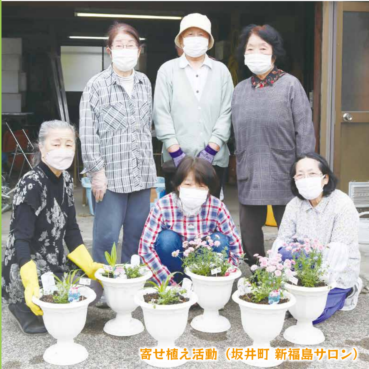
寄せ植え活動（坂井町 新福島サロン）