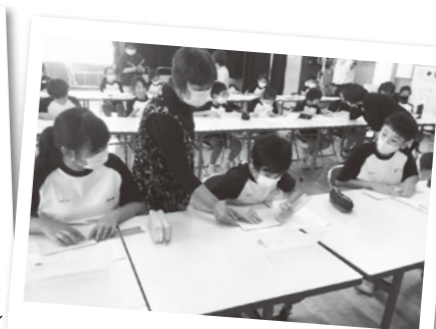
福祉教育(点字学習)