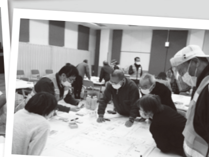
福祉講座(防災研修)