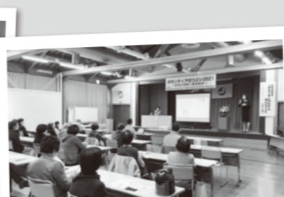
ボランティア活動支援