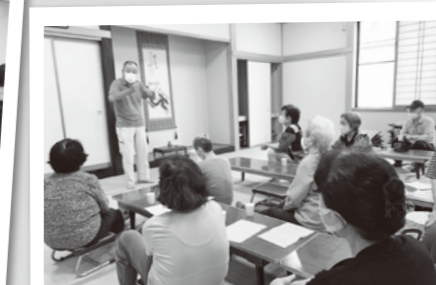
生活支援(移動サービス)