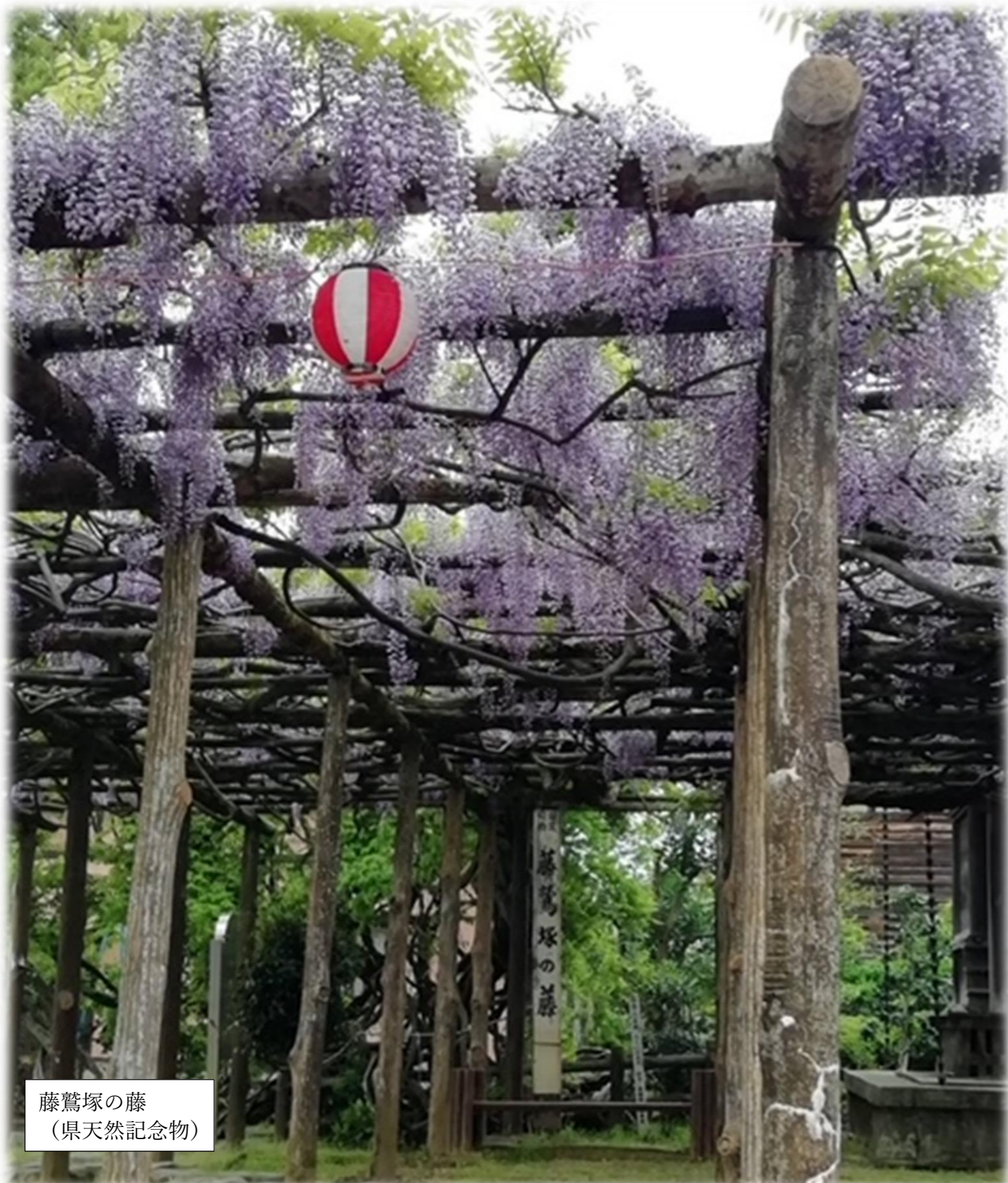
藤鷲塚の藤 (県天然記念物)